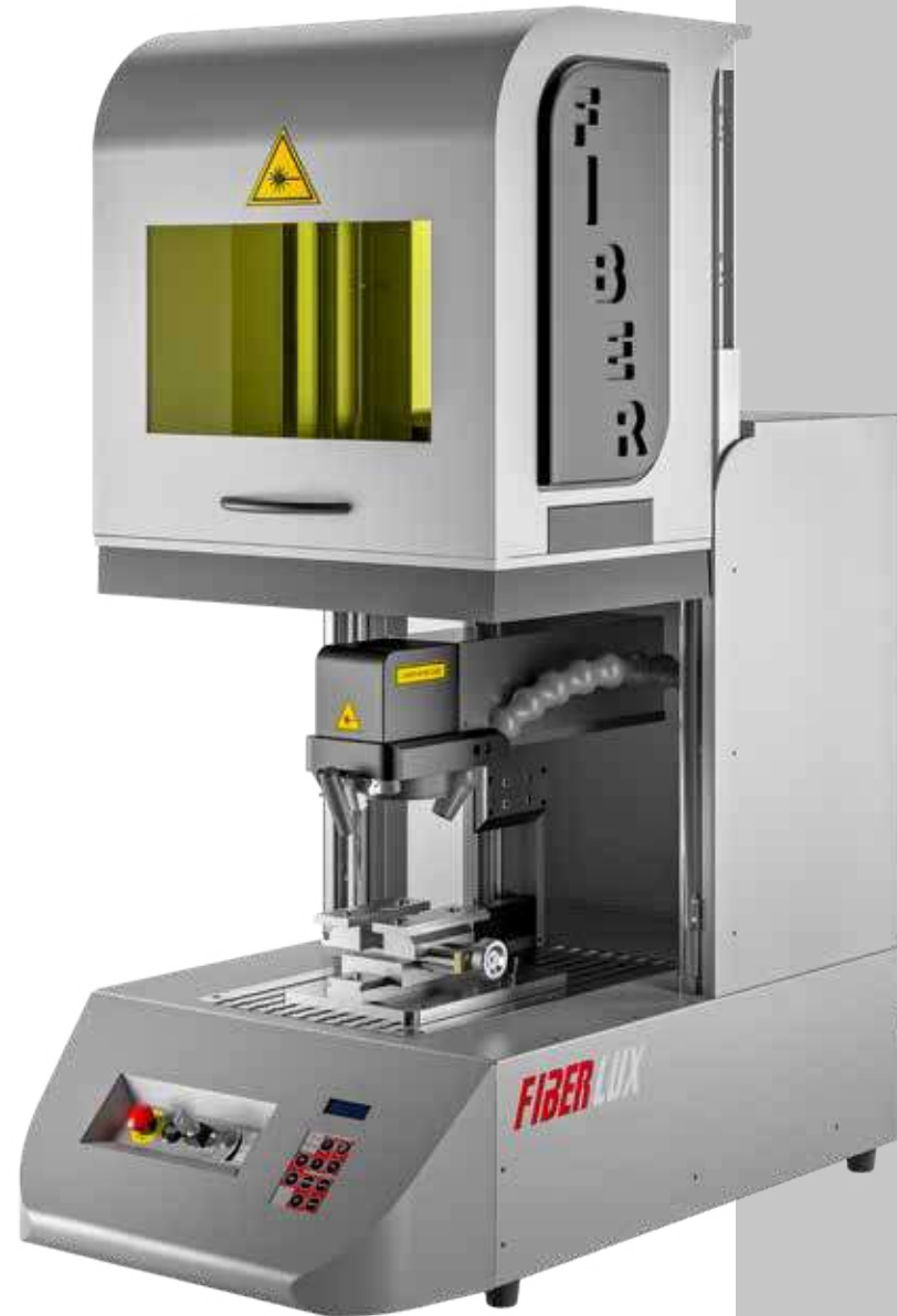
Chiusura camera di lavoro Laser chamber closing