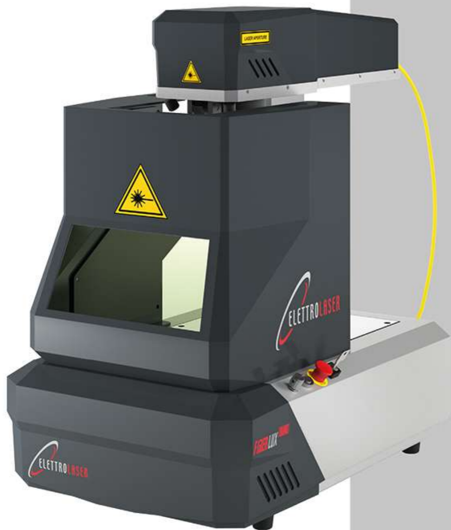
Z-axis manual adjustment Regolazione manuale asse Z