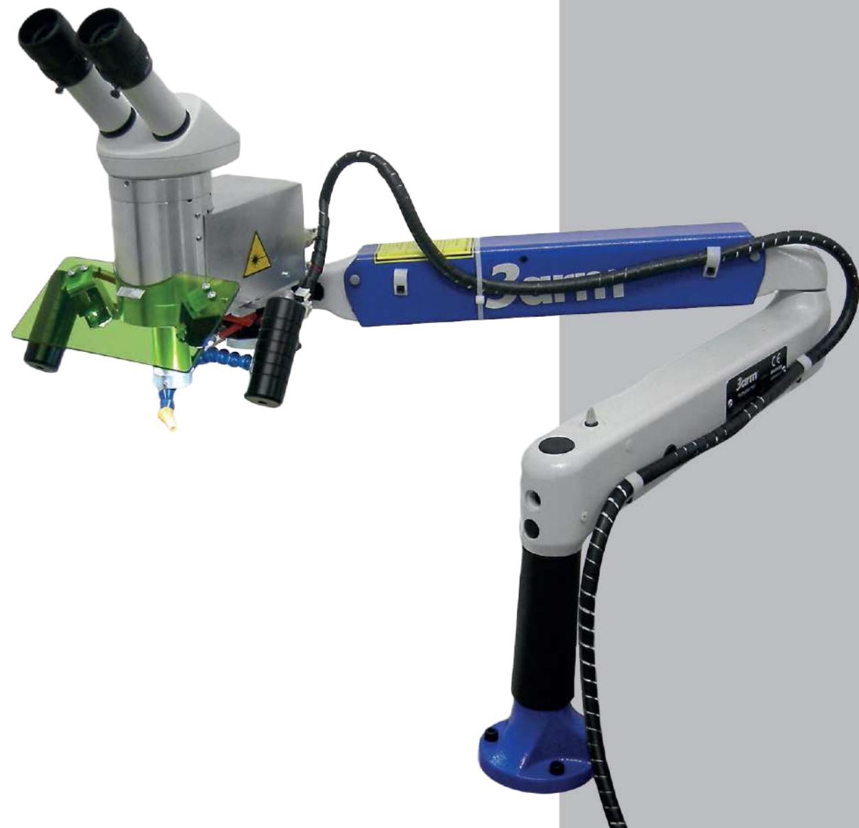
Improved vision Visione migliorata