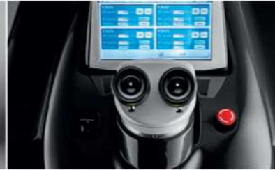
User-friendly HMI Interfaccia utente semplice