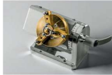
Rotor axis Rotore per saldature circolari