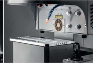
XYZ motorized table Tavola motorizzata a tre assi